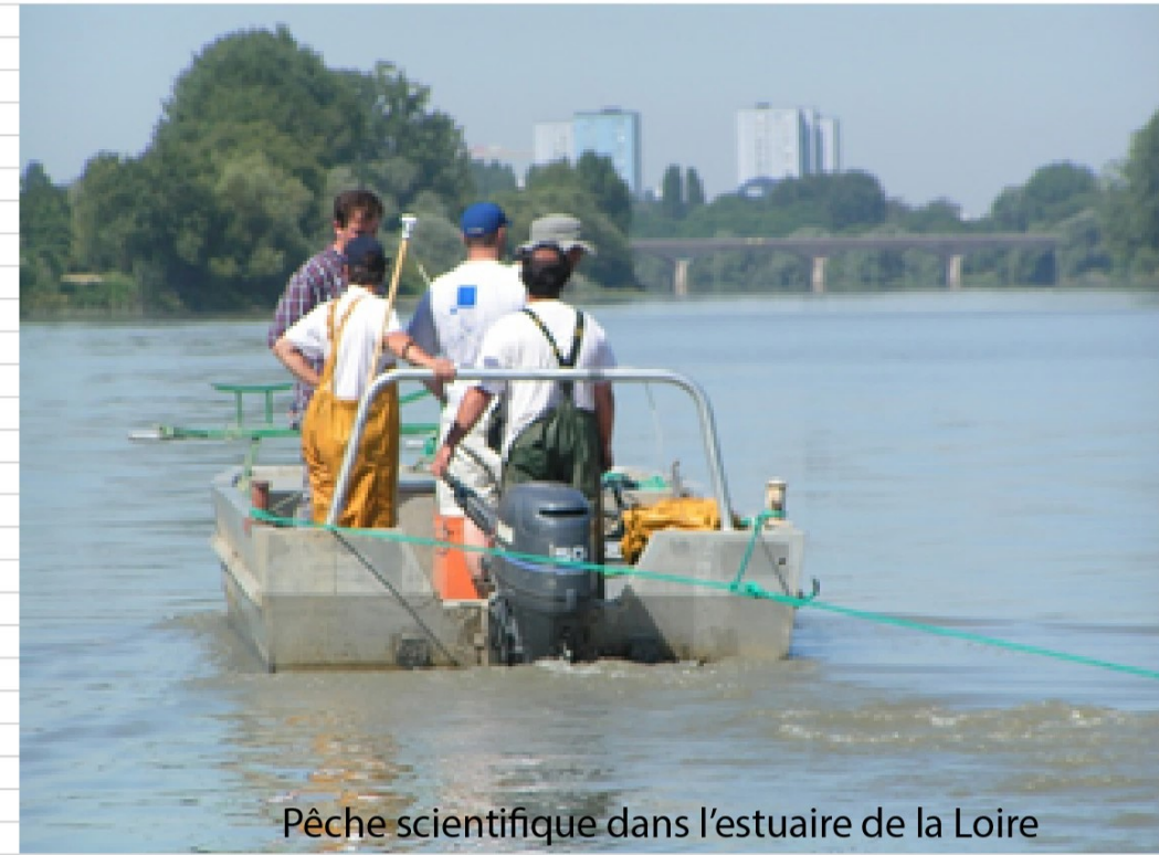
Pêche scientifique dans l'estuaire de la Loire