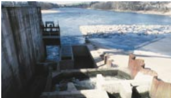
Station de comptage de Decize.

Les données de base sont les dénombrements de passages dans les stations de contrôle équipées, fournis par l'association LOGRAMI et obtenus soit par enregistrements vidéo soit par compteurs à résistivité. Seuls les résultats aux stations aval des cours d'eau sont retenus. Ce sont, pour la Loire, la station de Decize; sur l'Allier, la station de Vichy et sur la Gartempe, la station de Châteauponsac.